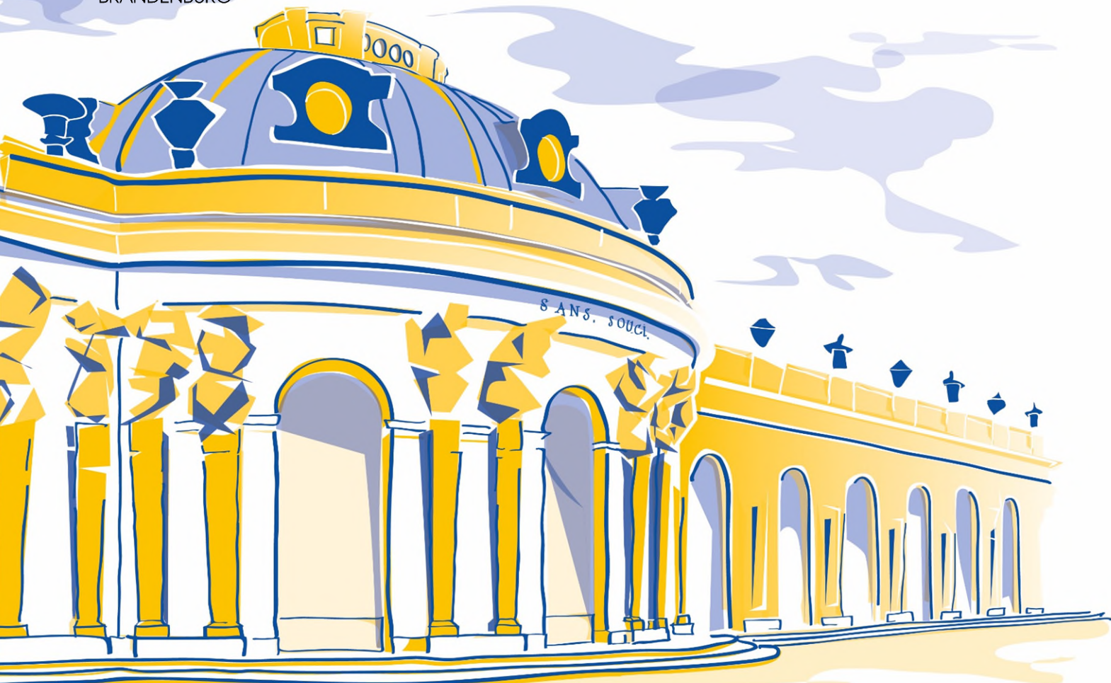
Schloss Sanssouci in Potsdam